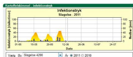
Figur 3. Infektionstryk ved Slagelse (Sjælland) viser to perioder med høj risiko for skimmel.