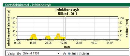
Figur 2. Infektionstrykket i Billund (Midtjylland) viser fortsat to perioder med middel risiko.